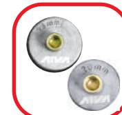
لقمه ۲۰ و ۲۵ میلیمتری