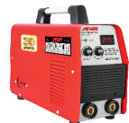
2101 Inverter welding machine دستگاه جوشکاری اینورتر ۲۱۵ آمپر IGBT