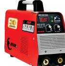
2161 Inverter welding machine دستگاه جوشکاری اینورتر ۲۲۰ آمپر سولوزی Plus