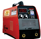
2118 Inverter welding machine دستگاه جوشکاری اینورتر ۲۵۰ آمپر IGBT