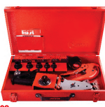
2302 Pipe welding machine set اتو لوله سبز کیفی