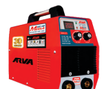
2170 Inverter welding machine دستگاه جوشکاری اینورتر ۲۰۰ آمپر MEGA