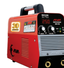
2115 Inverter welding machine دستگاه جوشکاری اینورتر ۲۵۰ آمپر IGBT