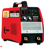
2119 Inverter welding machine دستگاه جوشکاری اینورتر ۳۱۵ آمپر IGBT