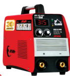
2162 Inverter welding machine دستگاه جوشکاری اینورتر ۳۱۵ آمپر سولوزی IGBT