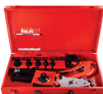
2302 Pipe welding machine set اتو نوله سبز کیفی