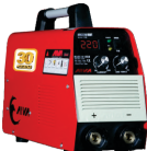
2102 Inverter welding machine دستگاه جوشکاری اینورتر ۲۲۰ آمپر IGBT