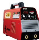
2115 Inverter welding machine دستگاه جوشکاری اینورتر ۲۵۰ آمپر IGBT