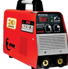
2161 Inverter welding machine دستگاه جوشکاری اینورتر ۲۲۰ آمپر سولاریز Plus