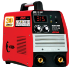
2119 Inverter welding machine دستگاه جوشکاری اینورتر ۳۱۵ آمپر IGBT