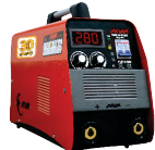
2118 Inverter welding machine دستگاه جوشکاری اینورتر ۲۸۰ آمپر IGBT