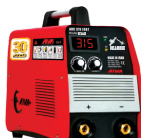
2162 Inverter welding machine دستگاه جوشکاری اینورتر ۳۱۵ آمپر سولاریز IGBT