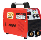
2111 Inverter welding machine دستگاه جوشکاری اینورتر ۲۰۰ آمپر IGBT